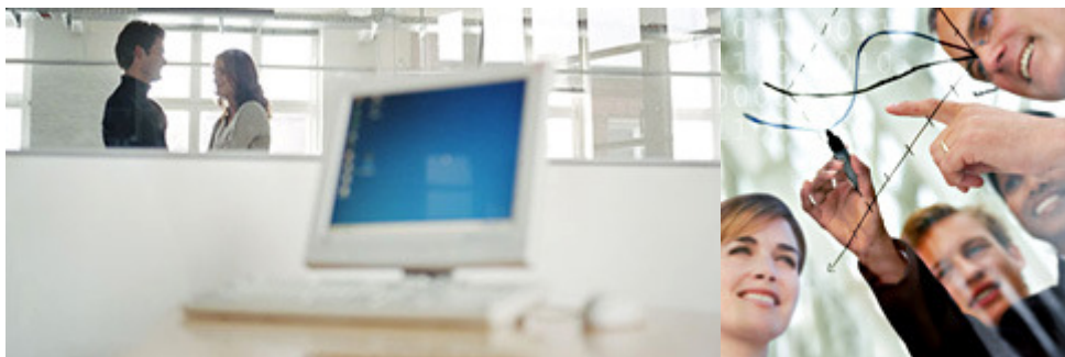
Die meisten IT-Unternehmen sind Software-Entwickler und Dienstleister

Schmid: Ich würde sagen: Software-Entwicklung und Dienstleistung ist der Hauptbereich. Es sind sehr viele Software-Firmen, Entwickler, die auch Software anpassen, implementieren. Dienstleistung, Stichwort IT-Infrastruktur oder -Architektur ist natürlich auch ein Thema, genauso wie Telekommunikation.